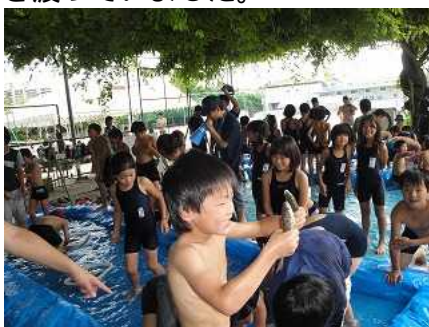
7月18日、19日センターパードのキャンプがありました。