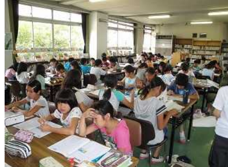
7月と8月の7日間学習相談日で、夏休みの課題の進み具合をチェックしました。