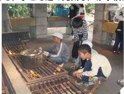
7月23日~26日 5年生は三瓶山へ野外活動へ行きました

夏休み前から、夏休み中も子ども達が継続的に学習できるように、様々な取り組みが行われました。休み中でも、子ども達の元気な声が学校に響き渡っていました。