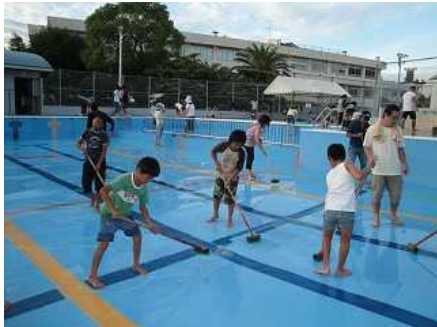
8月10日プール清掃を夕方6時から行いました。