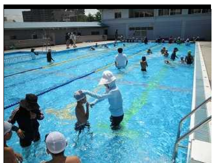
7月27日~29日 水泳指導がありました。