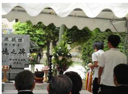
8月11日 慰霊祭が行われました。