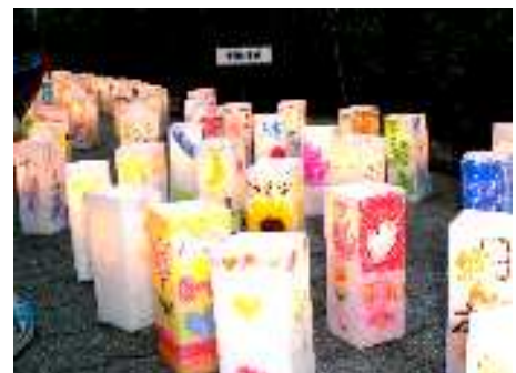
「わあ、きれい！」 思わず声があがりました。