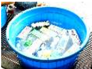
③じっくり冷やして