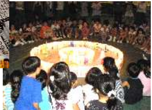
最後にキャンドルに火を灯し、皆で「アオギリの歌」を歌いました。