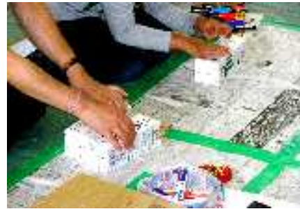
②「1.2.3.4.5！」コロソ！ 牛乳パックを転がす作業が 10分も続きます。