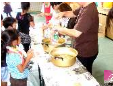
①溶けた蠟を牛乳パックに流し込みます。

今年も千田小学校では、原爆記念日の夜に平和の火を灯すイベントに参加するためピースキャンドルの製作を行いました。 ひろしま点灯虫の会と、教育活動部役員の方々の指導のもと、150名もの親子が集い「絆」をテーマにキャンドルを作成しました。