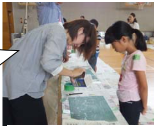
牛乳パックをはがして…

私は広島県外出身なので、小さい頃からこのような平和について考える機会になる活動をしていて素晴らしいと思います。子どもたちがまじめに取り組んでいて、よかったです。