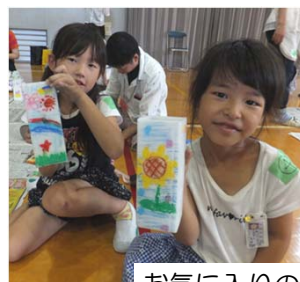
お気に入りの絵です！