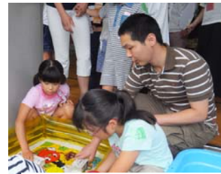
冷やしてロウを固めて…