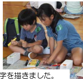
みんな、一生懸命、絵や文字を描きました。