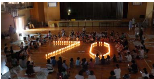
今年は被爆70年の「70」という数字の形に並べて点灯しました。