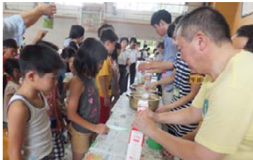
溶かしたロウを牛乳パックに流し込みます。

7月21日（火）に、ひろしま点灯虫の会と教育活動部のみなさんのご指導のもと、毎年恒例のピースキャンドル作りが行われました。今年は児童・保護者あわせて117名が参加しました。