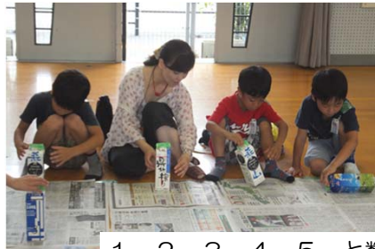
1, 2, 3, 4, 5, と数えながら牛乳パックをまわして…